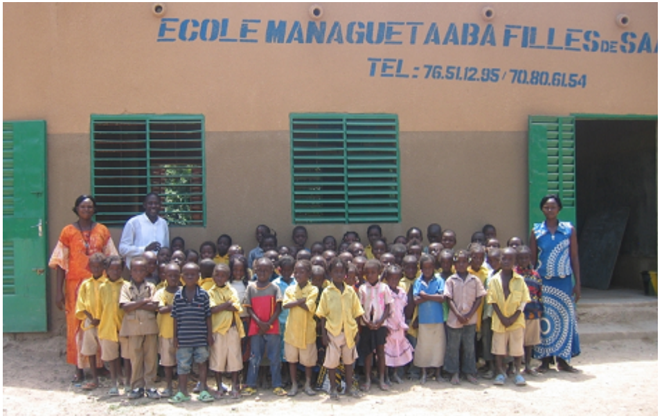
La classe de CP2 en 2011